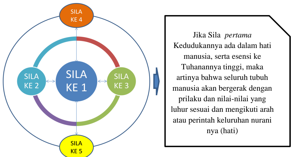
Gambar. 1. Hubungan Sila 1-5 Pancasila

Hubungan sila pertama dengan sila selanjutnya tidak dapat dipisahkan satu dengan yang lainnya, merupakan satu kesatuan yang utuh, seperti tubuh manusia yang