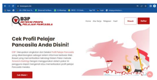
Gambar 1. Tampilan Awal atau Home Aplikasi D3P.

Aplikasi D3P merupakan inovasi assessment profile pelajar Pancasila berbasis website yang dapat diakses melalui link berikut https://kewargaan.site/ . Pengembangan aplikasi D3P melibatkan ahli untuk memvalidasi kualitas mutu aplikasi tersebut yang di mana didapat kesimpulan akhir dari ahli bahwa aplikasi D3P dianggap layak untuk diimplementasikan. Aplikasi D3P, wujud dari upaya menciptakan pembelajaran melalui proses penilaian atau asesmen dengan memanfaatkan teknologi informasi dan komunikasi berbasis website sehingga aplikasi D3P dapat secara fleksibel diberdayakan. Sebagaimana dijelaskan oleh Vural dan Zelner dalam (Meduri, Firdaus , & Fitriawan, 2022), bahwa pemanfaatan teknologi informasi dan komunikasi kedalam pembelajaran akan memberikan dampak positif terhadap perwujudan suasana belajar yang fleksibel.