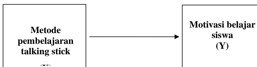
Tabel 3.1 Desain Penelitian

Terdapat dua variabel penelitian yaitu satu variabel independen dan satu variabel dependen. Variabel independen yaitu metode pembelajaran talking stick dengan simbol X dan variabel dependen yaitu motivasi belajar siswa dengan simbol Y.