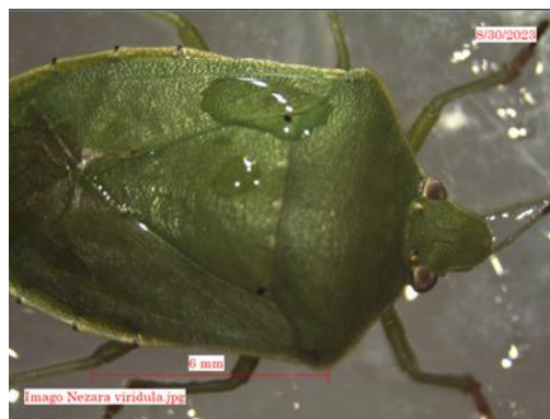
Gambar 7. Imago N. viridula

Imago terbentuk setelah melewati lima instar nimfa. Imago N. viridula memiliki bentuk tubuh segilima seperti perisai, dengan rata-rata ukuran panjang 14 mm dan lebar 6 mm. Imago N. viridula memiliki dua pasang sayap, sayap depan tebal yang menyerupai kulitnya, sedangkan pada bagian ujung sayap memiliki selaput yang tipis, atau disebut hemelytron. Sayap akan menyatu saat N. viridula sedang beristirahat, N. viridula akan meletakkan sayap di bagian atas abdomen dengan bagian ujung yang saling tumpang tindih. Sehingga, akan terlihat warna titik-titik putih pada bagian tubuh N. viridula . Bagian kepala N. viridula terdapat sepasang antenna, mata facet, dan oceli. Imago N. viridula memiliki pronotum yang berbagi dua terdiri dari gelambir posterior dan anterior. Imago N. viridula memiliki mulut berbentuk paruh (probosis) dan sungkut yang cukup panjang yang terdiri dari empat atau lima ruas. Bagian tungkai N. viridula pada bagian depan bersifat pemangsa, yang memiliki femur berukuran besar dan dilengkapi dengan duri-duri yang besar pada batas ventroposterior. Secara keseluruhan imago N. viridula berwarna hijau polos dengan kepala dan pronotum berwarna jingga atau kuning keemasan, serta ujung tungkai tibia berwarna hitam (Gambar 7). Morfologi pada fase imago merupakan fase terakhir dari siklus hidup N. viridula . Lama stadium imago berkisar 20-60 hari. Nezara viridula merupakan serangga yang memiliki lama hidup yang cukup lama.