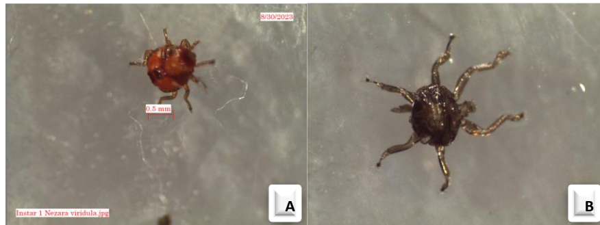
Gambar 2. Nimfa instar 1 (A) N. viridula normal; (B) eksuvia N. viridula (Dokumentasi pribadi)

menghabiskan waktu berkisar 5 menit. Nimfa instar 1 ini akan hidup berkelompok pada awal menetas dan belum membutuhkan makanan. Nimfa instar 1 ini lebih senang pada keadaan yang lembab atau suhu yang tinggi. Nimfa instar 1 N. viridula memiliki warna tubuh orange kemerahan, dan di beberapa titik tubuhnya berwarna kecoklatan. Nimfa instar 1 N. viridula memiliki bentuk tubuh oval dan mengerucut pada bagian kepala, dengan rata-rata ukuran panjang 1 mm dan lebar 0,8 mm (Gambar 2A). Nimfa instar 1 N. viridula akan terus berkembang berkisar 4 hari dan selanjutnya memasuki nimfa instar 2. Nimfa instar 1 N. viridula akan meninggalkan eksuvia dengan tekstur yang tipis berwarna coklat bening (Gambar 2B).