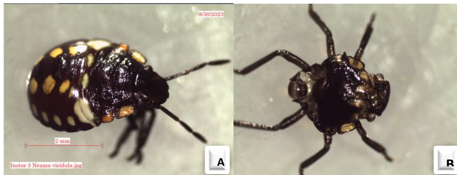
Gambar 6. Nimfa instar 5 (A) N. viridula normal; (B) eksuvia N. viridula