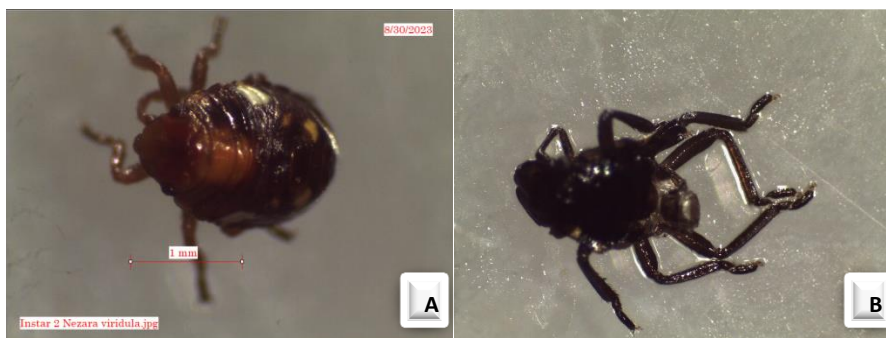
Gambar 3. Nimfa instar 2 (A) N. viridula normal; (B) eksuvia N. viridula

Nimfa instar 1 N. viridula yang telah berganti kulit ( molting ) akan menjadi nimfa instar 2. Nimfa instar 2 N. viridula dalam masa perkembangannya sudah mulai aktif mencari makan dengan cara menusuk dan menghisap pakan. Nimfa instar 2 N. viridula berbentuk oval dengan warna tubuh semakin menggelap menjadi orange kecoklatan, pada bagian dorsal terdapat titik-titik berwarna kuning yang menyerupai corak pada bagian tengah tubuh N. viridula . Nimfa instar 2 N. viridula memiliki rata-rata ukuran panjang 2 mm dan lebar 1,3 mm (Gambar 3A). Pada bagian nimfa instar 2 N. viridula sudah mulai terlihat jelas antena dan tungkai yang berwarna kehitaman. Lama stadium nimfa instar 2 N. viridula berkisar 8-10 hari, dan selanjutnya akan memasuki nimfa instar 3. Nimfa instar 2 N. viridula akan meninggalkan eksuvia berwarna kehitaman (Gambar 3B) pada saat berganti kulit ( molting ).